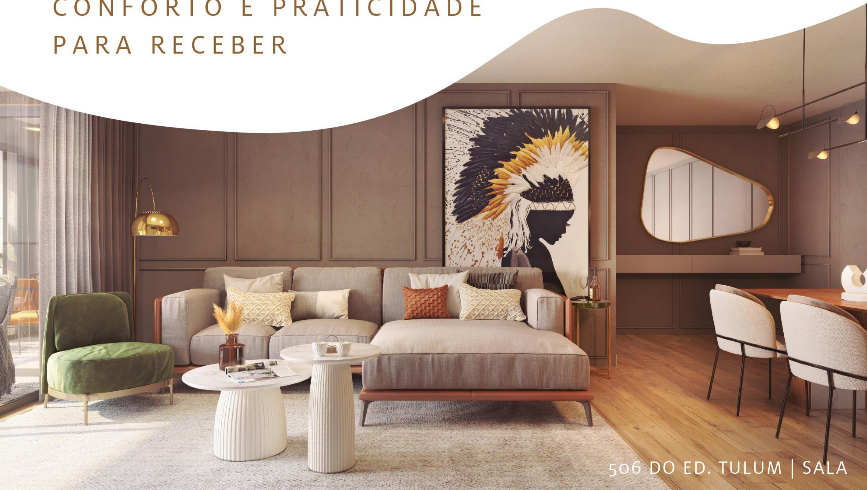
506 DO ED. TULUM | SALA