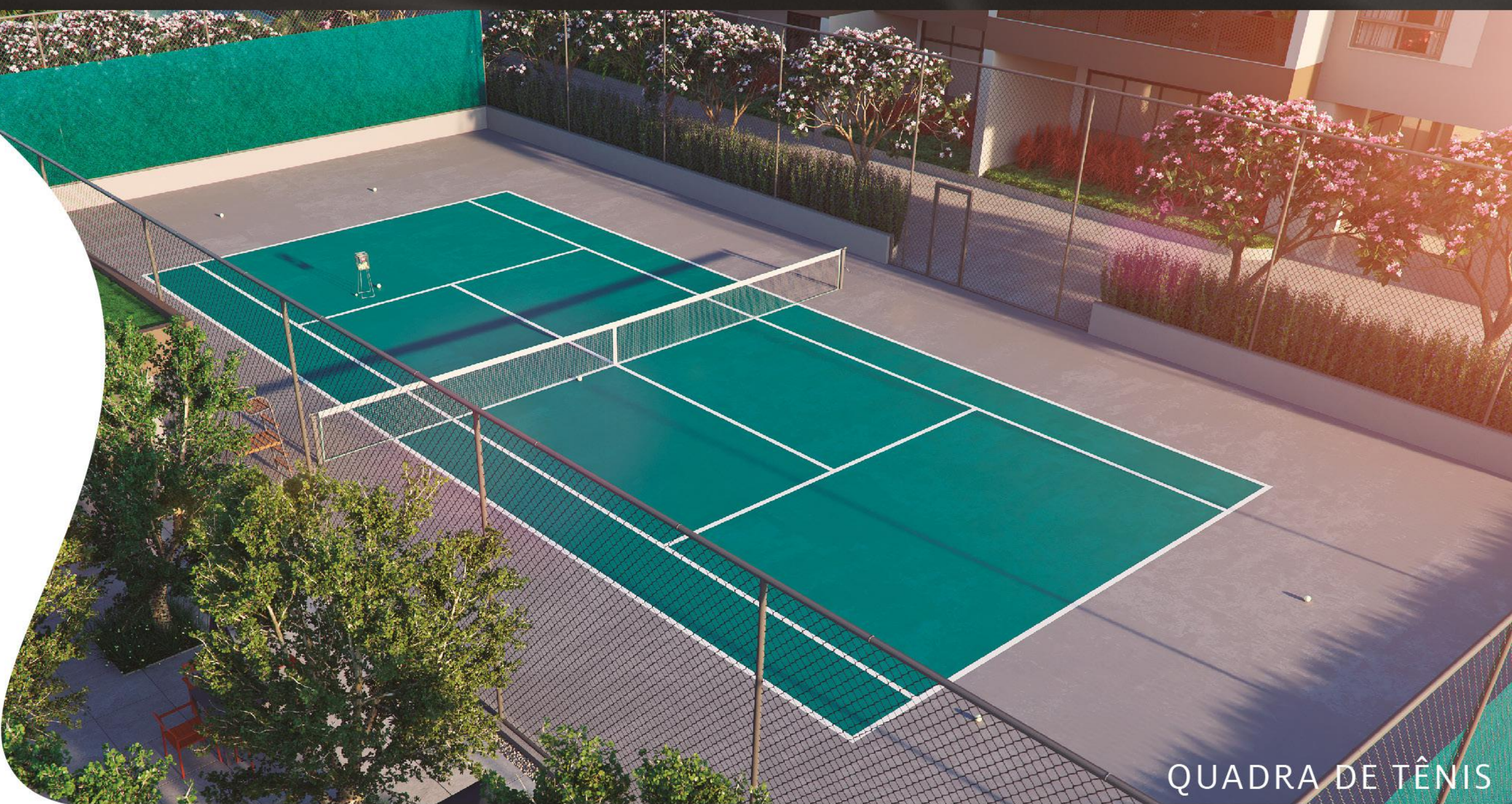
QUADRA DE TÊNIS