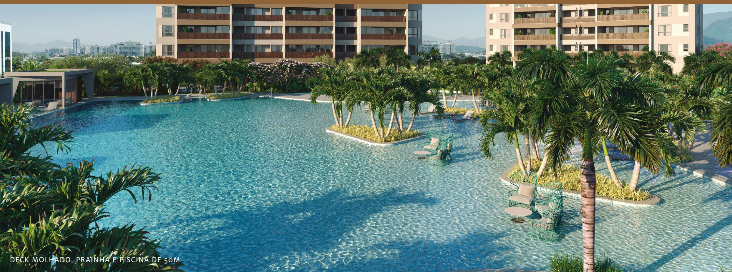
DECK MOLHADO, PRAÍHA E PISCINA DE 50M