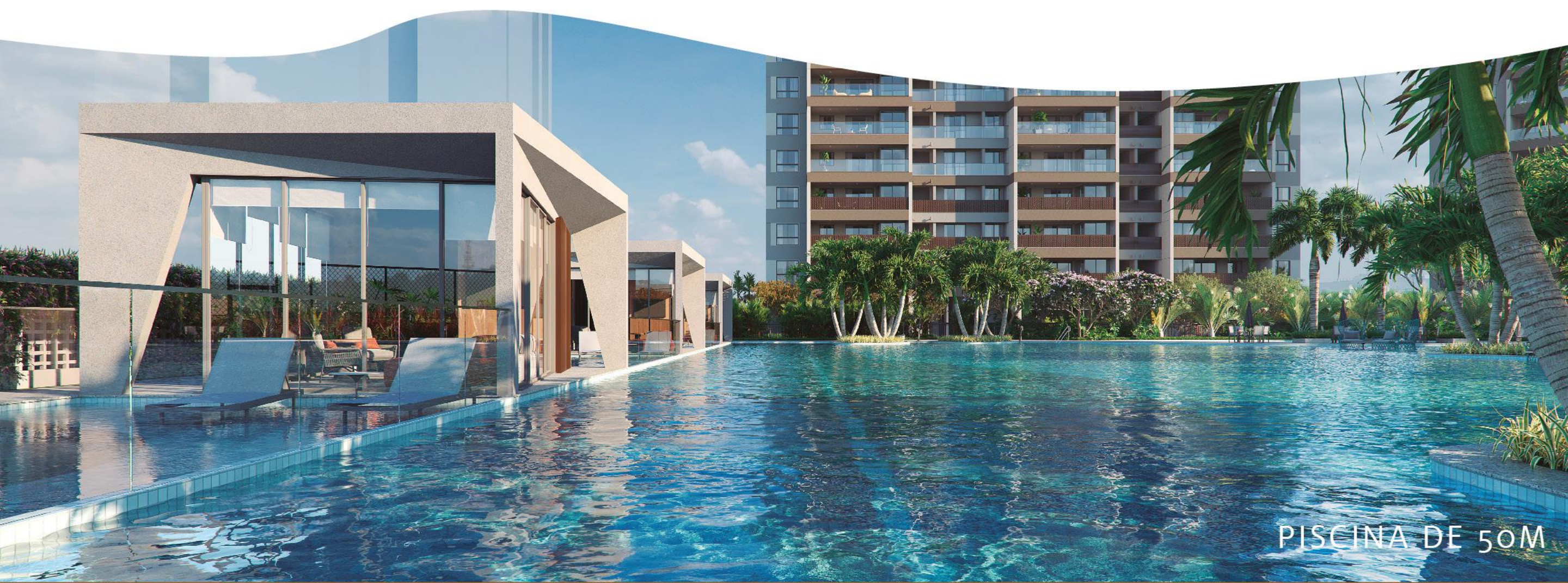
PISCINA DE 50M

UM AMBIENTE INSPIRADO NOS FAMOSOS BEACHS CLUBS INTERNACIONAIS