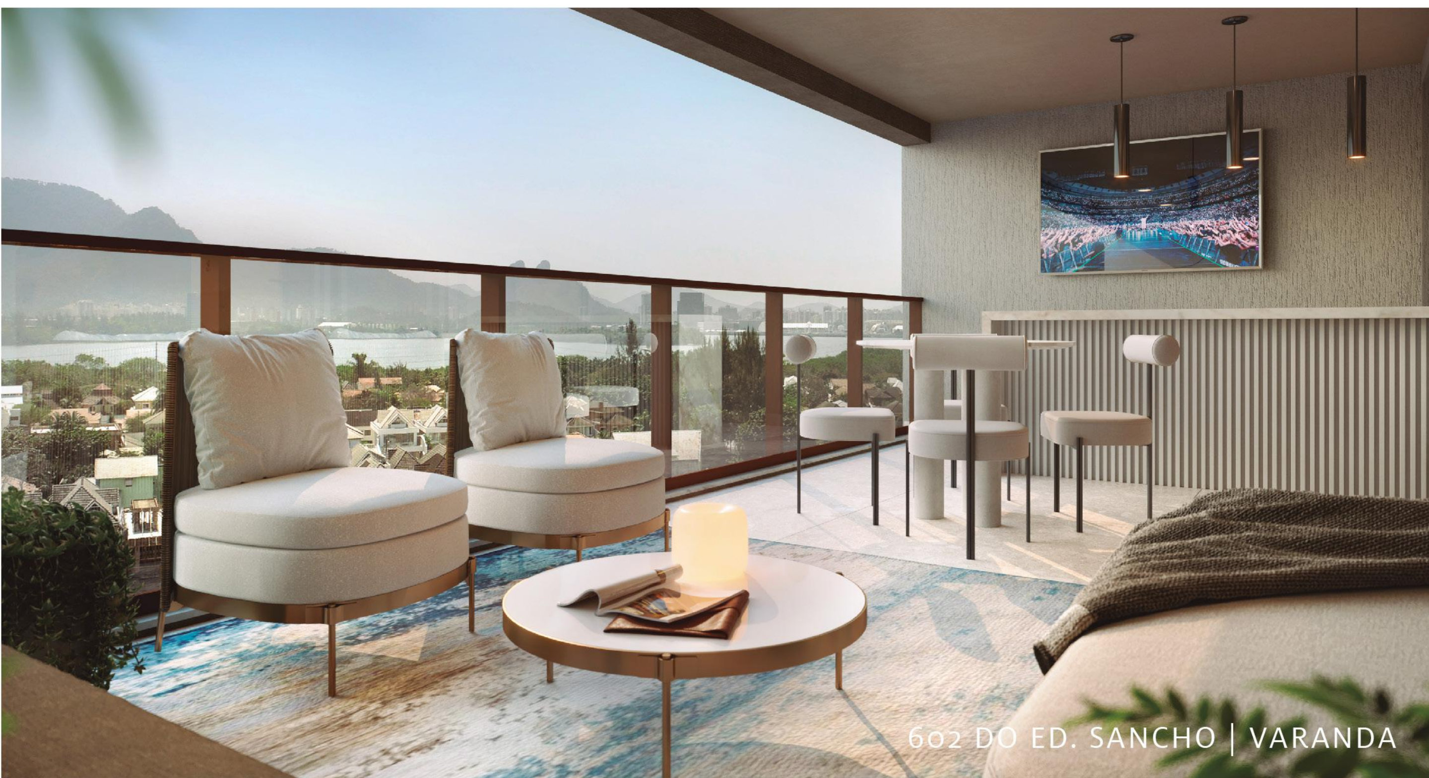
602 DO ED. SANCHO | VARANDA