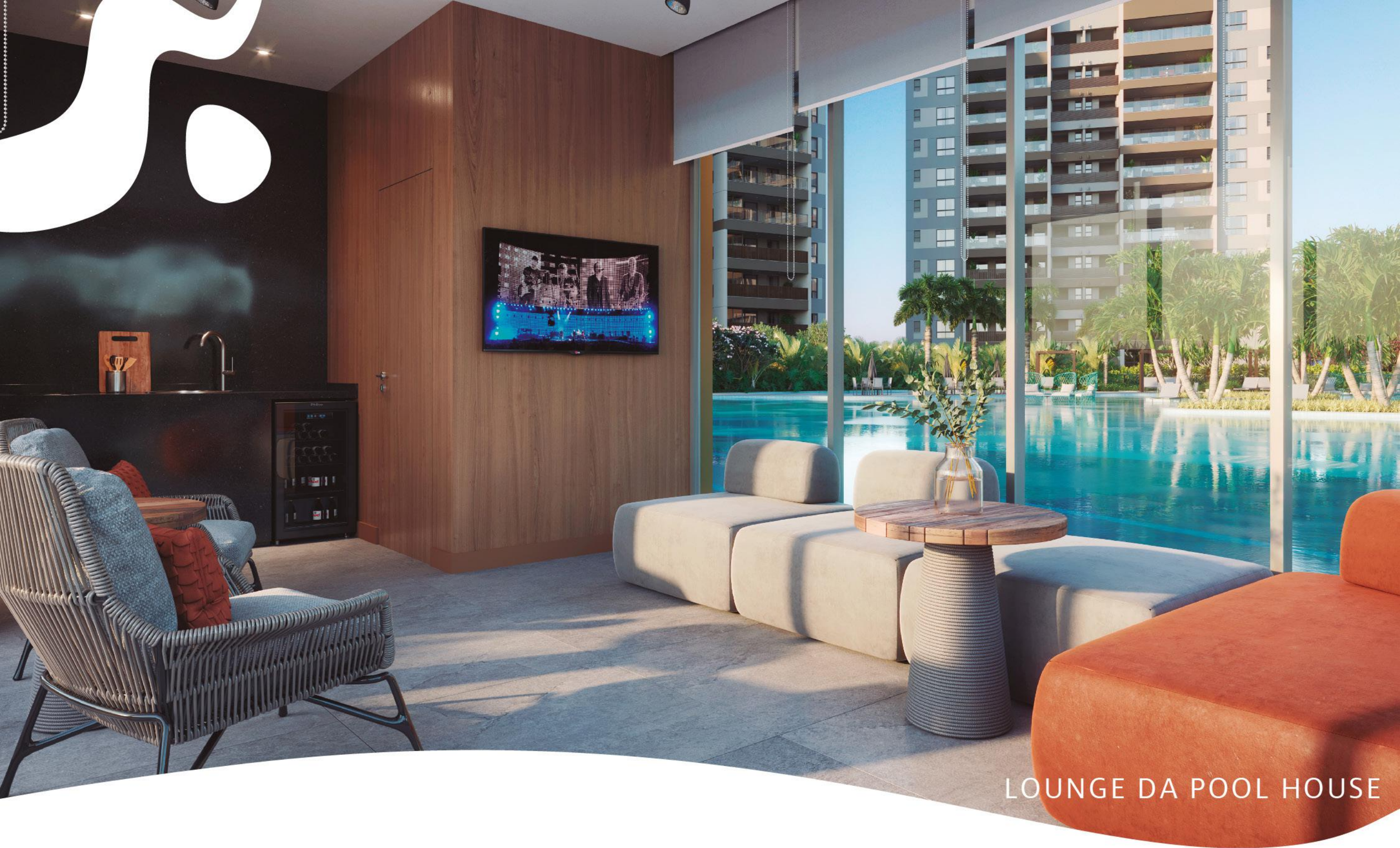
LOUNGE DA POOL HOUSE

UM AMBIENTE INSPIRADO NOS FAMOSOS BEACHS CLUBS INTERNACIONAIS