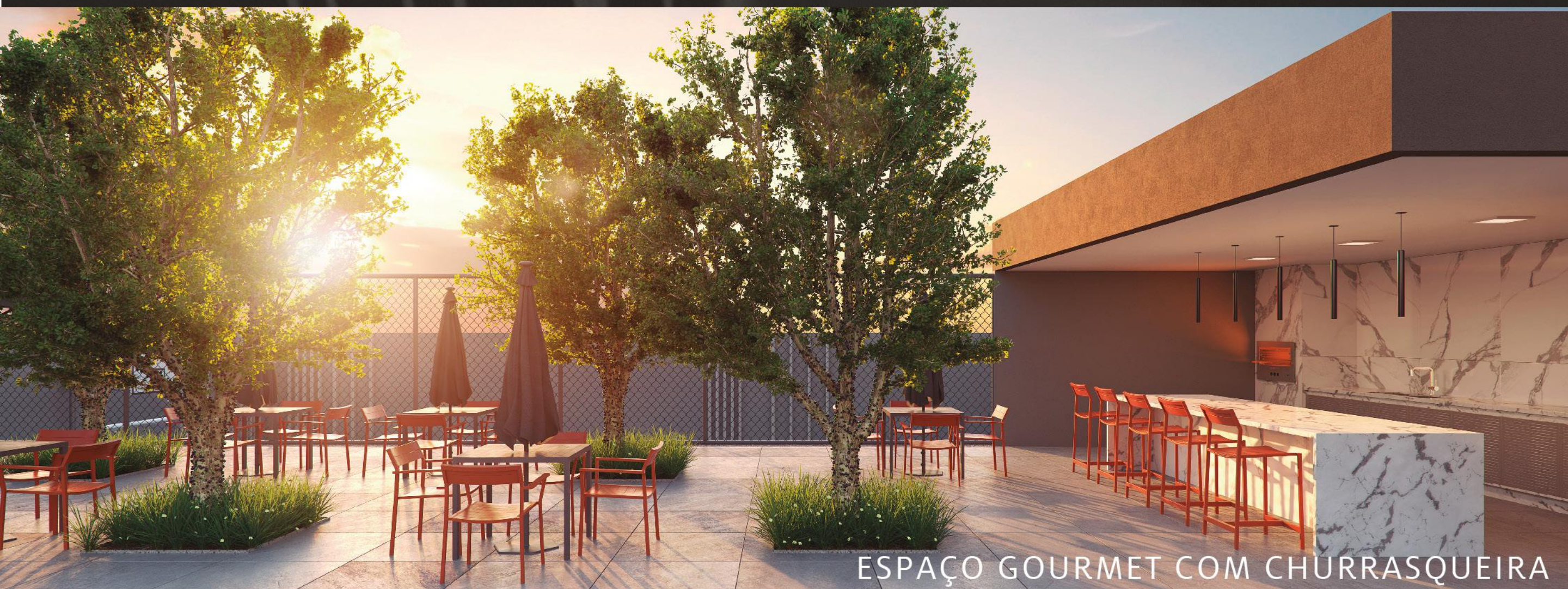
ESPAÇO GOURMET COM CHURRASQUEIRA

ESPAÇOS EXCEPCIONAIS QUE UNEM CONFORTO E COMODIDADE