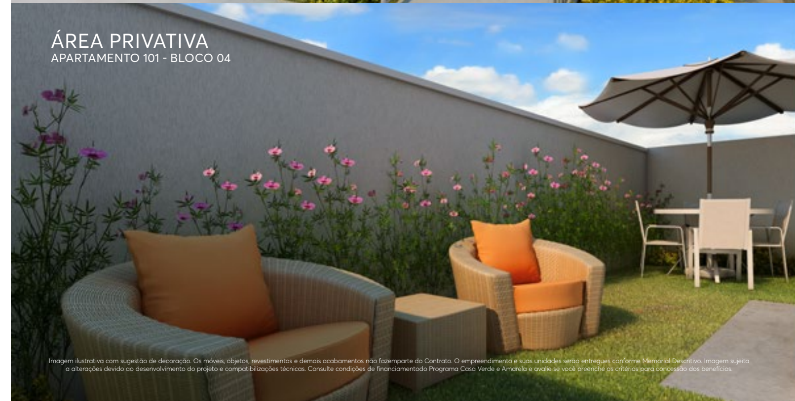
ÁREA PRIVATIVA APARTAMENTO 101 - BLOCO 04

Imagem ilustrativa com sugestão de decoração. Os móveis, objetos, revestimentos e demais acabamentos não fazem parte do Contrato. O empreendimento e suas unidades serão entregues conforme Memorial Descritivo. Imagem sujeita a alterações devido ao desenvolvimento do projeto e compatibilizações técnicas. Consulte condições de financiamento do Programa Casa Verde e Amarela e avalie se você preenche os critérios para concessão dos benefícios.