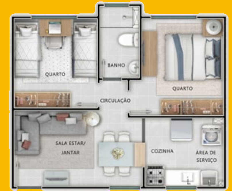
Ref.: Apartamento 104 - Bloco 4