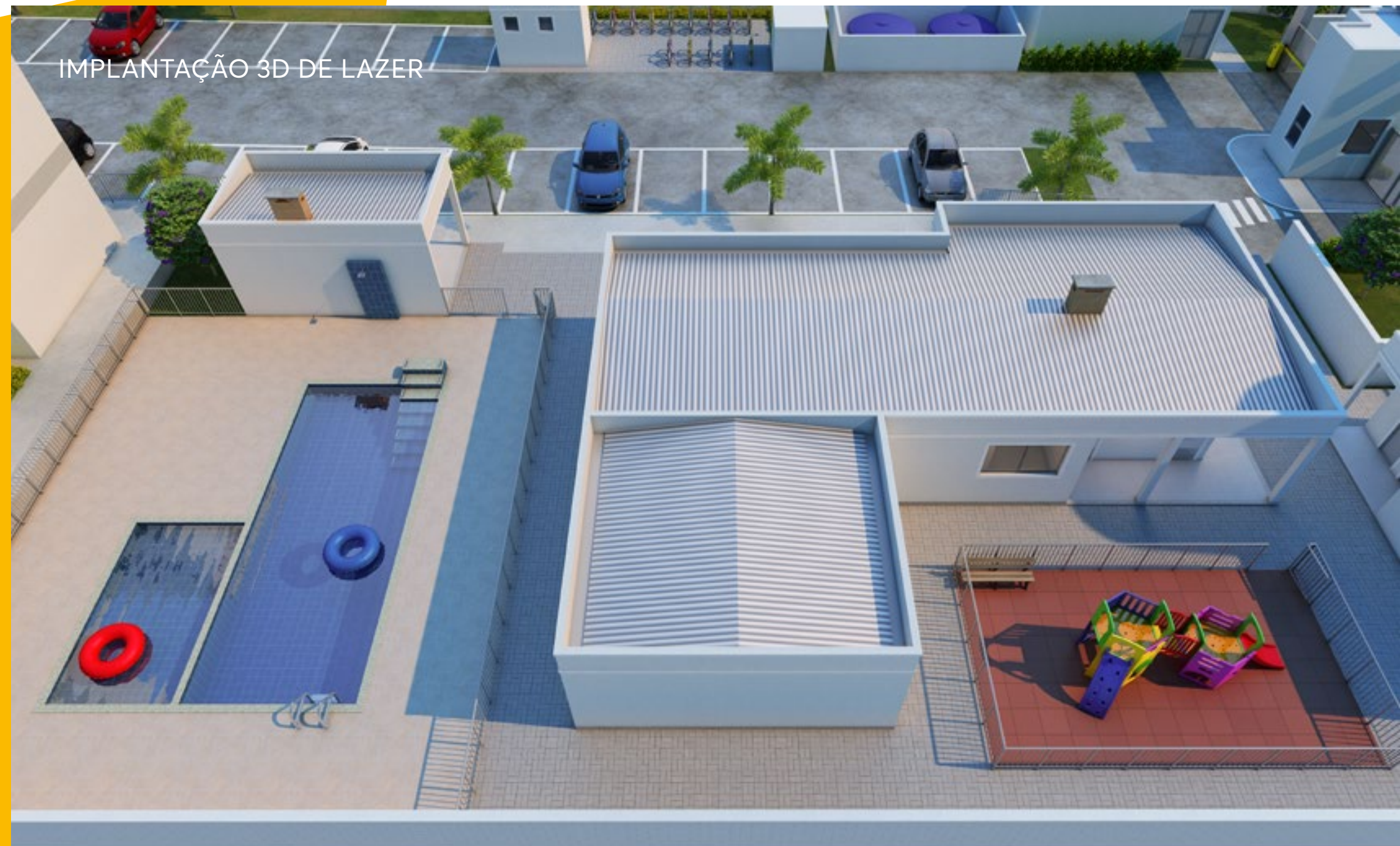
IMPLANTAÇÃO 3D DE LAZER

Castelo d'água: Manutenção de responsabilidade do Condomínio. Infraestrutura para ar-condicionado. Aparelho e instalação não inclusos. Preparação para medição de água individualizada Estação de Tratamento de Esgoto - ETE. Manutenção de responsabilidade do condomínio. Infraestrutura para ar-condicionado. Aparelho e instalação não estão inclusos, de responsabilidade do condomínio. Interfone: será instalado sistema de intercomunicação entre guarita e unidades privativas que funcionará através da rede de telefonia móvel disponível no local. (para este caso a responsabilidade de contratação da operadora de telefonia e do aparelho será do cliente) ou sistema tradicional com cabeamento (nesse caso será entregue um aparelho de interfone por apartamento). Independente do sistema utilizado as tubulações seca e sondada serão entregues (sem fiação).