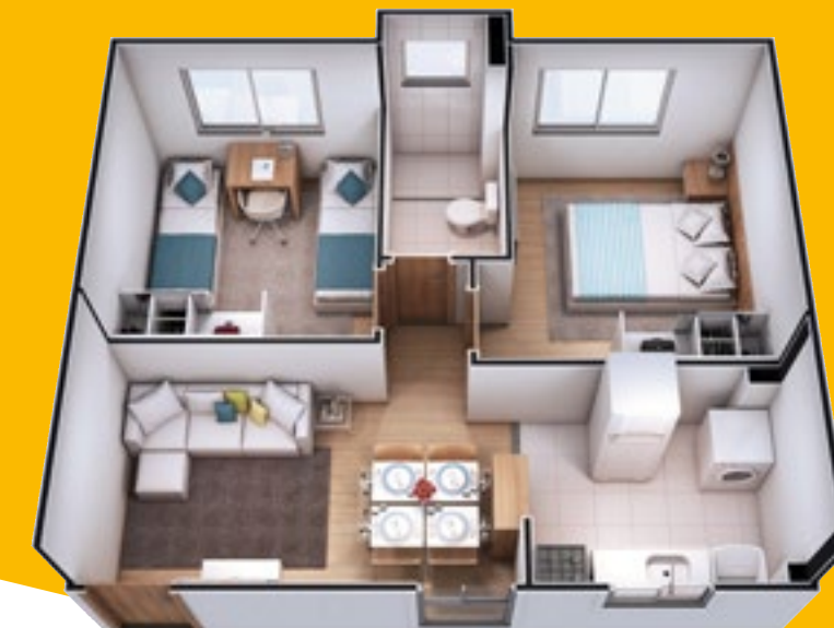
Ref.: Apartamento 204 - Bloco 4