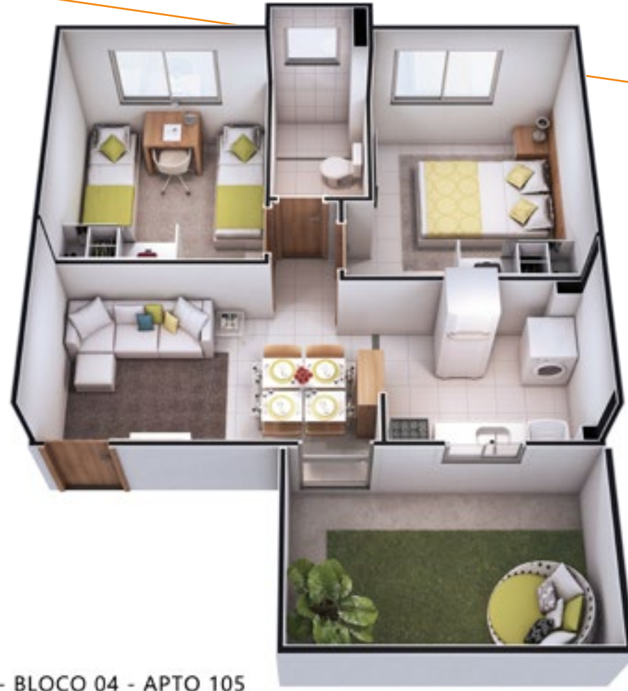
IL - BLOCO 04 - APTO 105