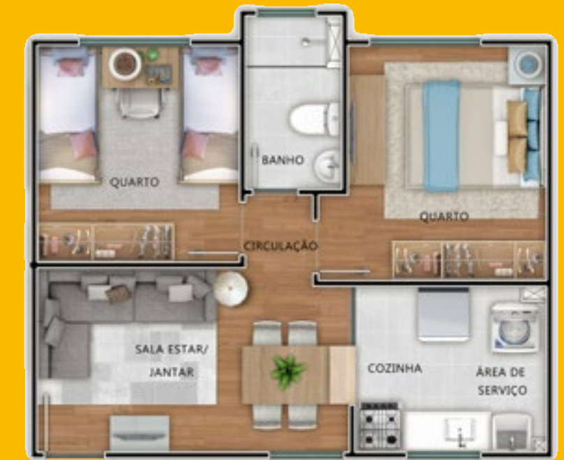
Ref.: Apartamento 204 - Bloco 4