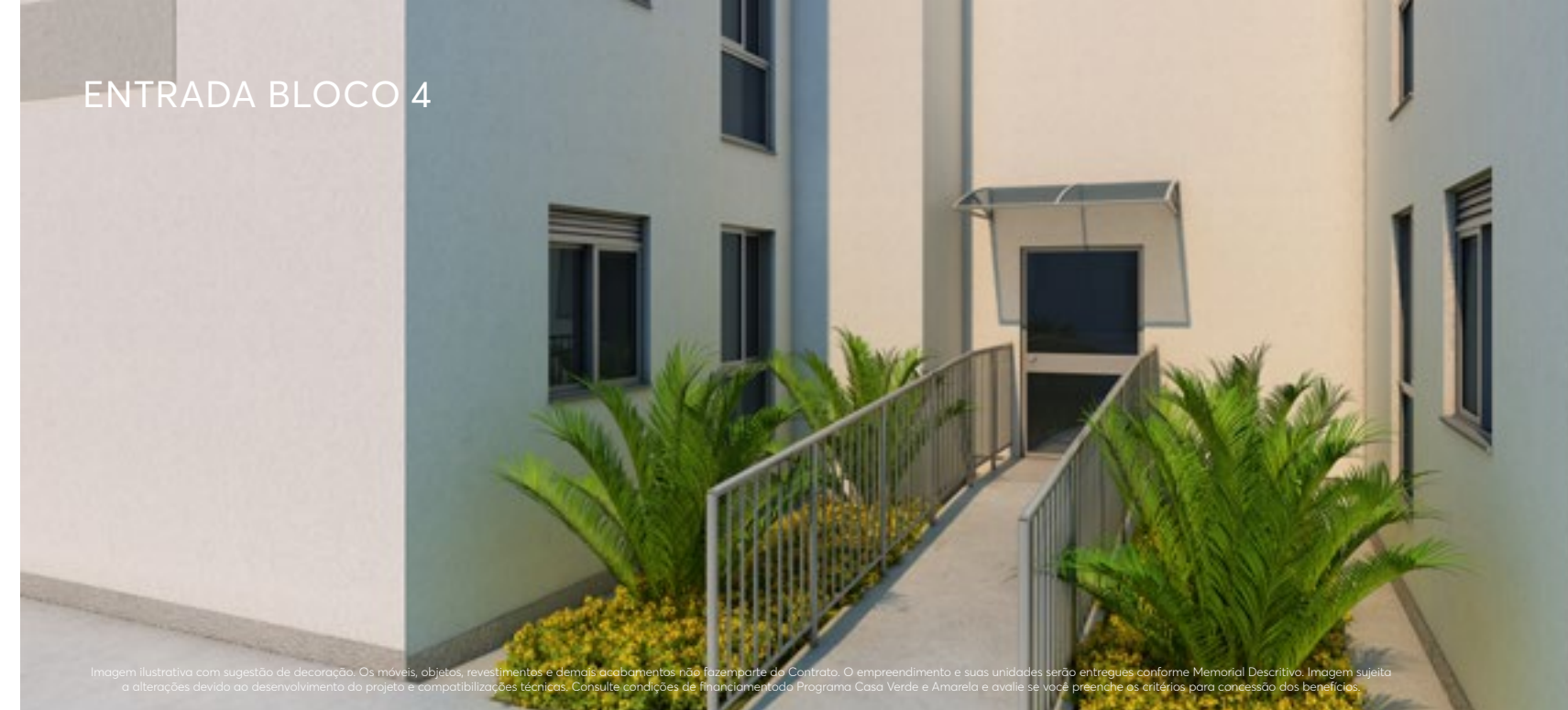
ENTRADA BLOCO 4

Imagem ilustrativa com sugestão de decoração. Os móveis, objetos, revestimentos e demais acabamentos não fazem parte do Contrato. O empreendimento e suas unidades serão entregues conforme Memorial Descritivo. Imagem sujeita a alterações devido ao desenvolvimento do projeto e compatibilizações técnicas. Consulte condições de financiamento do Programa Casa Verde e Amarela e avalie se você preenche os critérios para concessão dos benefícios.