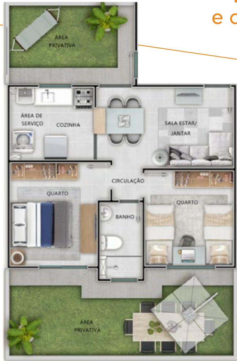
Ref.: Apartamento 101 - Bloco 4

Espaço, funcionalidade e até opções com área privativa.