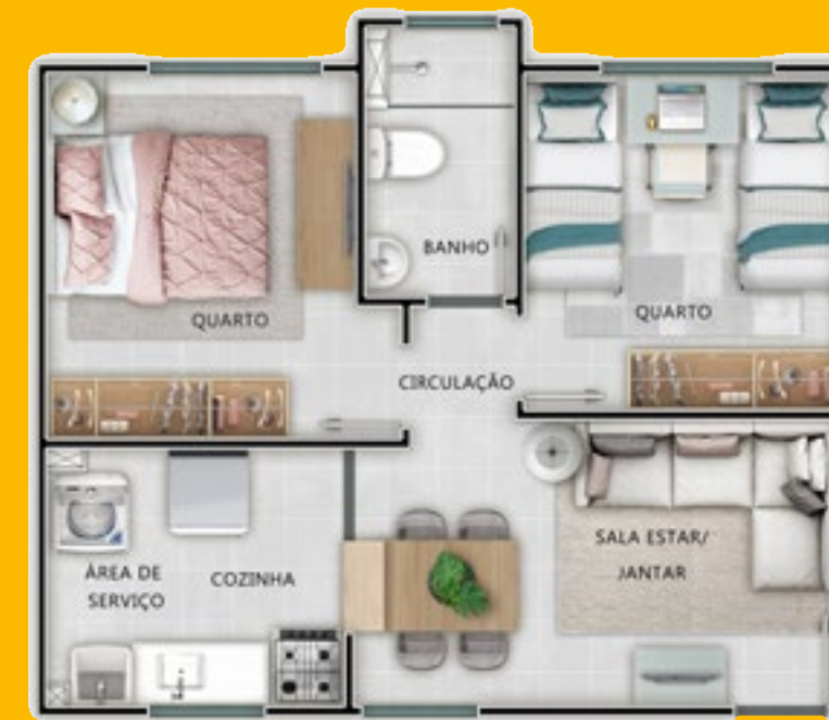
Ref.: Apartamento 103 - Bloco 4