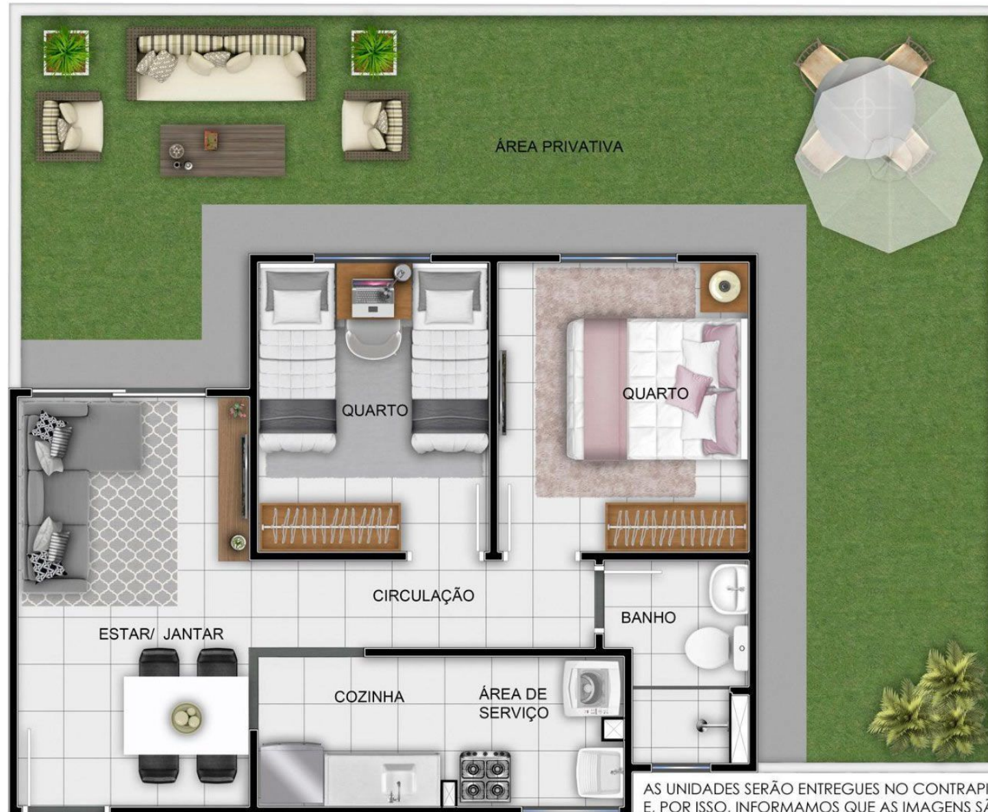
PLANTA APTO 104 - BLOCO 02

AS UNIDADES SERÃO ENTREGUES NO CONTRAPISO E, POR ISSO, INFORMAMOS QUE AS IMAGENS SÃO MERAMENTE ILUSTRATIVAS.