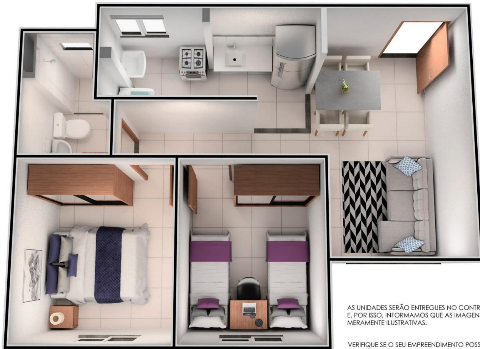
ISOMÉTRICA - PLANTA APTO 201 - BLOCO 02

AS UNIDADES SERÃO ENTREGUES NO CONTRAPISO E, POR ISSO, INFORMAMOS QUE AS IMAGENS SÃO MERAMENTE ILUSTRATIVAS.