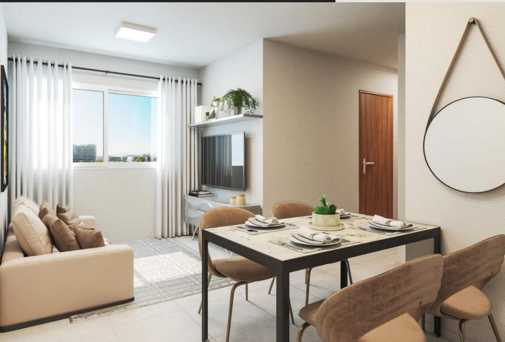
SALA - APTO 201 - BLOCO 02

AS UNIDADES SERÃO ENTREGUES NO CONTRAPISO E, POR ISSO, INFORMAMOS QUE AS IMAGENS SÃO MERAMENTE ILUSTRATIVAS.